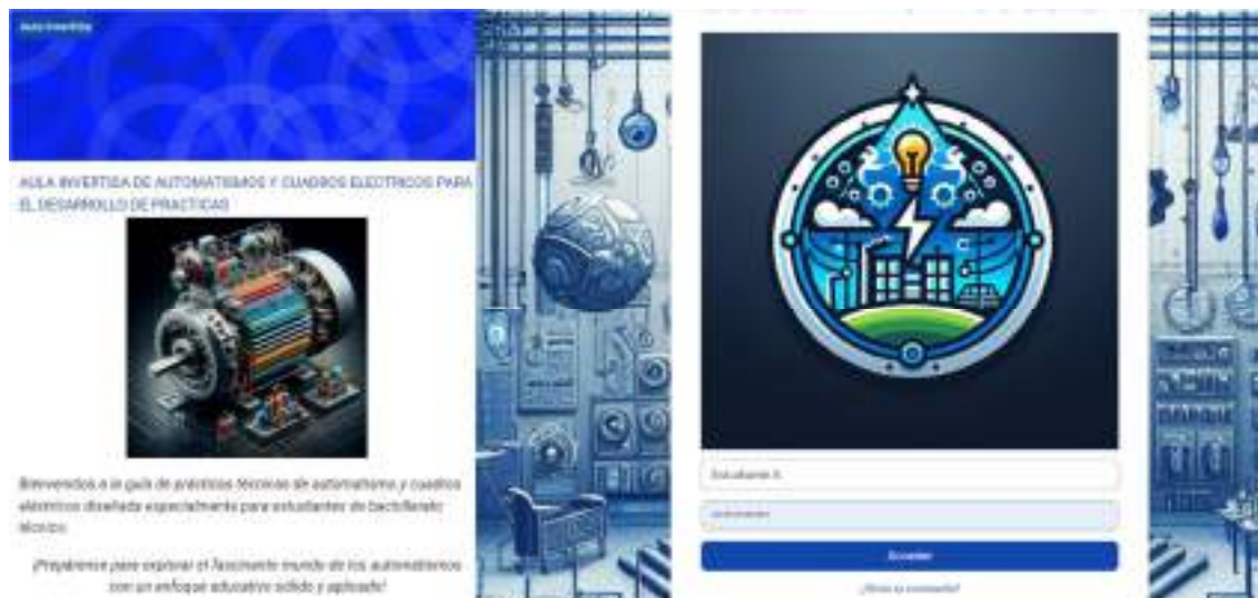
Figura 3. Interfaz de inicio del aula invertida digital

Nota. Fuente: Elaboración de los investigadores.