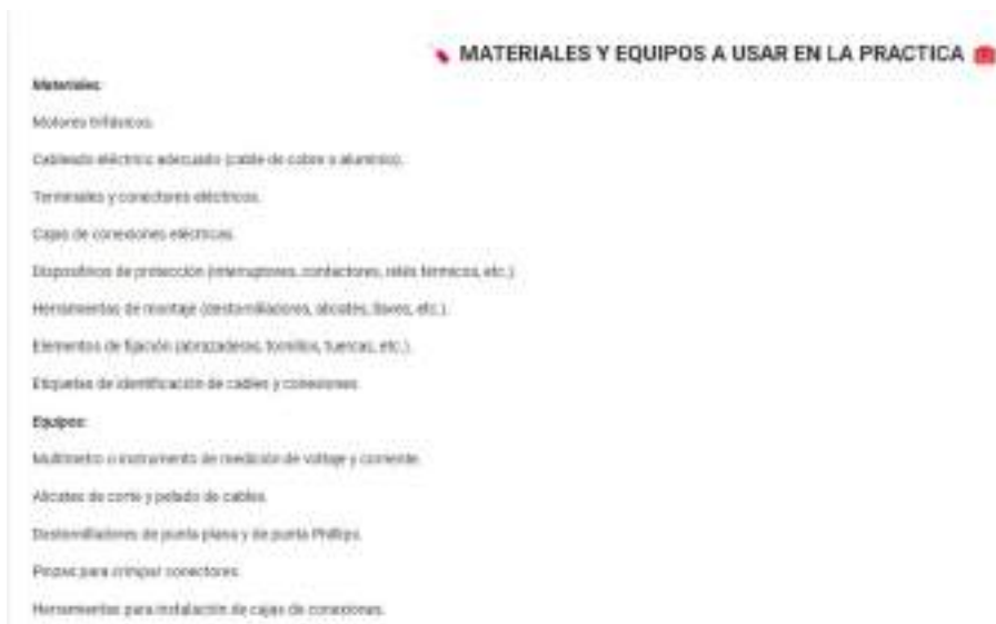
Figura 10. Apartado del listado de materiales y equipos a utilizar en la práctica.

Nota. Fuente: Elaboración de los investigadores.