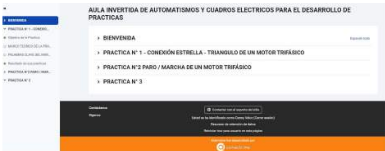
Figura 5. Menú del contenido del aula invertida digital.

Nota.