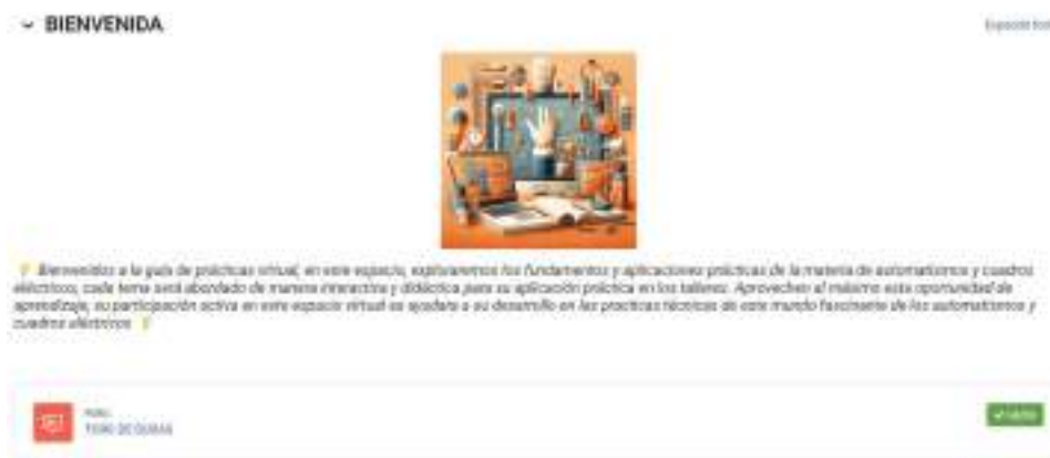
Figura 6. Bienvenida y foro de dudas

Nota. Fuente: Elaboración de los investigadores