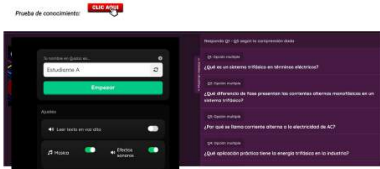
Figura 9. Evaluación del marco teórico.

Nota. Fuente: Elaboración de los investigadores.