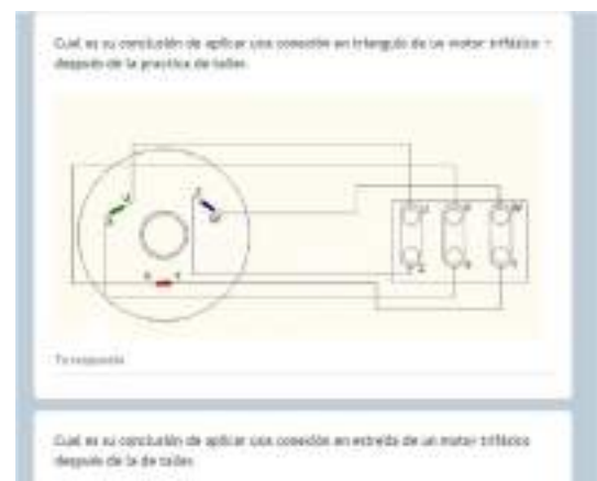
Figura 12. Formulario de informe de prácticas

Informe de prácticas , después de realizar una conexión triángulo-estrella de un motor trifásico en el aula taller cumple varias finalidades esenciales en la educación técnica. En primer lugar, permite a los estudiantes reflejar y consolidar el conocimiento adquirido durante la práctica, organizando y documentando los procedimientos seguidos, los resultados obtenidos y las conclusiones derivadas de la experiencia, el informe de prácticas proporciona una oportunidad para evaluar la comprensión de los conceptos teóricos y su aplicación práctica por parte de los estudiantes. Esto incluye la capacidad para interpretar y analizar los datos recopilados durante la conexión del motor trifásico en triángulo y estrella, así como para identificar posibles errores o mejoras en el proceso, realizar un informe de prácticas después de llevar a cabo la conexión triángulo-estrella de un motor trifásico en el aula taller tiene como finalidad principal consolidar el aprendizaje, evaluar la comprensión y aplicación de los conocimientos, desarrollar habilidades de comunicación técnica y proporcionar retroalimentación para el crecimiento individual de los estudiantes.