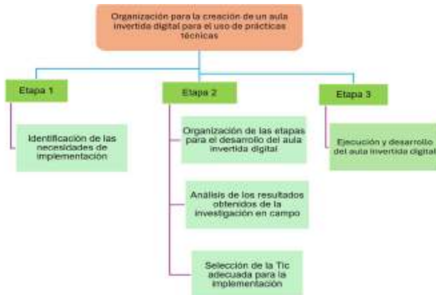
Figura 2. Etapas de la modelación

Nota.