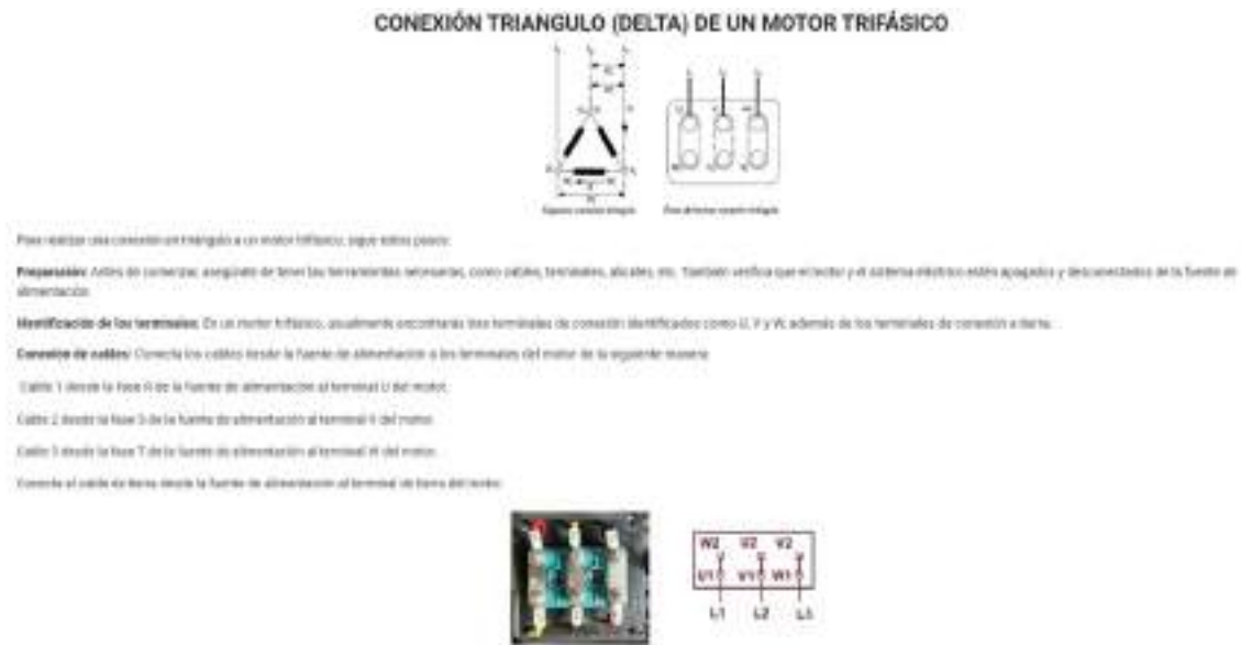
Figura 11 Sección del procedimiento de prácticas

Nota. Fuente: Elaboración de los investigadores.