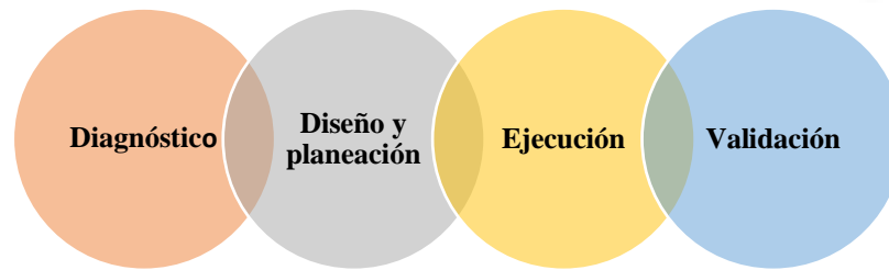
Estructura de la propuesta

Dentro de los fundamentos considerados para el diseño de la estrategia didáctica se contemplan cinco pilares fundamentales: primero, la identificación de las necesidades específicas del estudiante; segundo, el desarrollo de adaptaciones curriculares personalizadas; tercero, el empleo de una diversidad de herramientas de evaluación y adaptación que abarcan apoyos verbales/auditivos, visuales, físicos/táctiles y psicológicos/clínicos/educativos; cuarto, la adaptación de los materiales y las tareas; y quinto, una metodología de evaluación enfocada en el individuo a lo largo del proceso educativo. La misma quedo estructurada en título, objetivo general, objetivos específicos, introducción, fundamentación, descripción, ejecución y validación de resultados