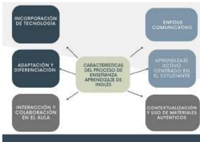
Figura 1 características del proceso de enseñanza aprendizaje del inglés

Fuente: Chapelle (2003); Richards, & Rodgers, (2001)