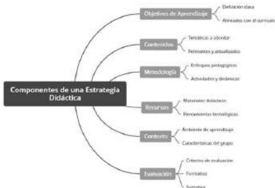
Figura 2 Elementos de una estrategia didáctica