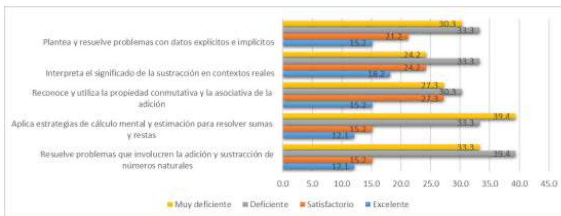
Figura 1. Resultados cuantitativos de la prueba pedagógica a estudiantes durante el diagnóstico inicial

El diagnóstico inicial del aprendizaje de la adición y sustracción de números de hasta cuatro dígitos en estudiantes del cuarto año se desarrolló mediante la aplicación de una prueba pedagógica a los estudiantes, complementada con una entrevista dirigida a los docentes responsables del grupo. Esta fase tuvo como propósito identificar logros e insuficiencias en el proceso de aprendizaje, así como explorar las causas de las dificultades detectadas. En la figura 1 se presentan los resultados cuantitativos de la prueba pedagógica a estudiantes durante la etapa de diagnóstico inicial.