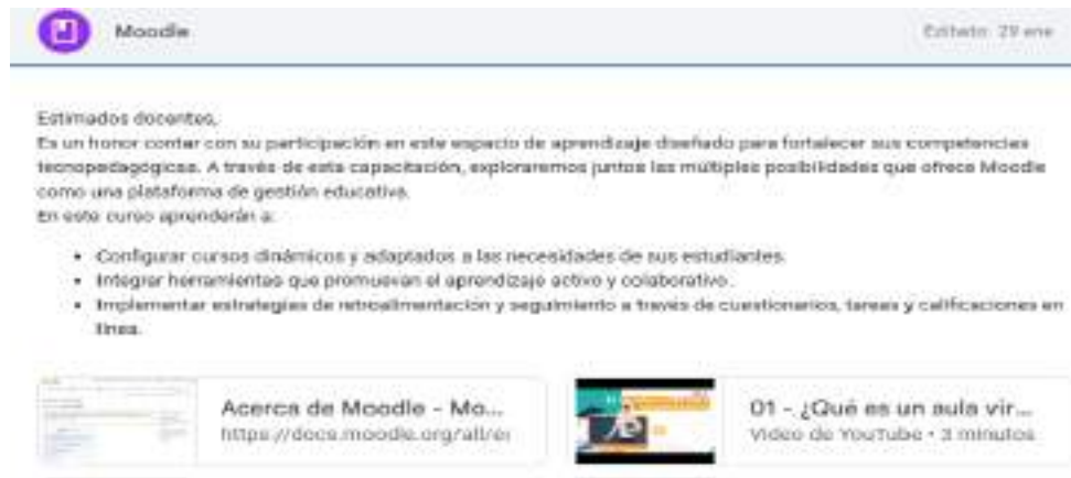
Figura N° 3. Del Módulo 1. Moodle

Nota. En esta figura se muestra el contenido de la herramienta Moodle.