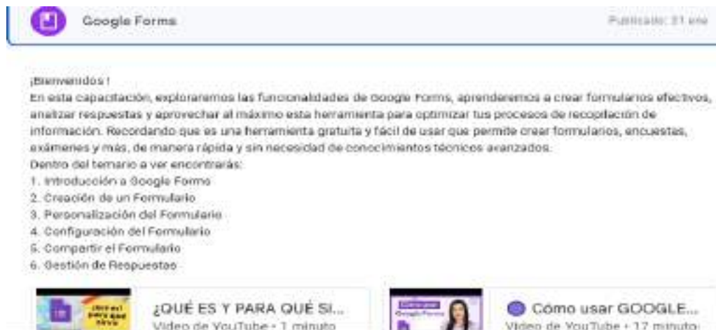
Figura N° 8. Del Módulo 3. Google forms

Nota. La siguiente figura muestra todo lo referente a la herramienta Google forms y sus recursos para la capacitación.