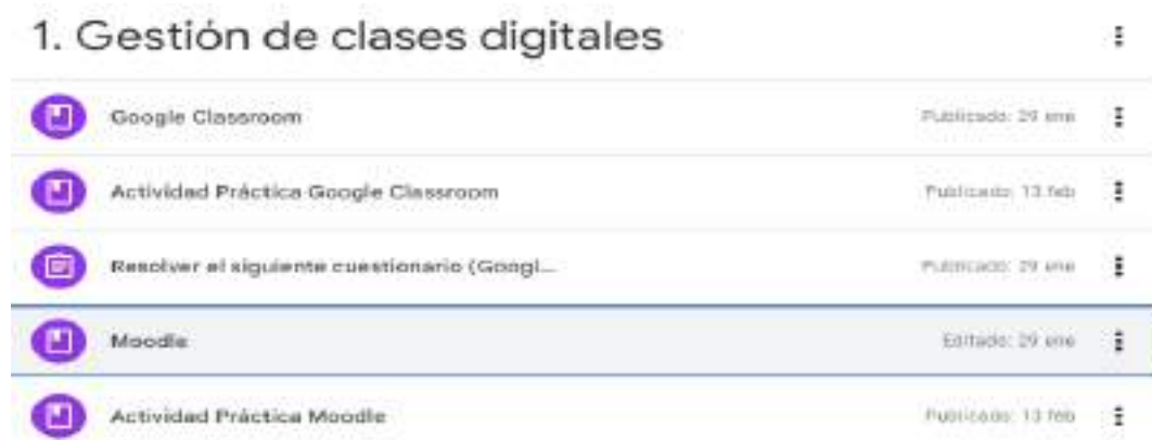
Figura N°. 1. Del Módulo 1. Gestión de clases digitales

Nota. Esta figura muestra como está conformado el primer módulo de la capacitación.