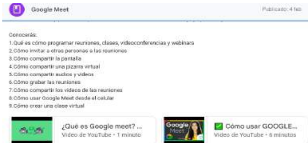
Figura N° 12. Del Módulo 4. Google Meet

Nota. La siguiente figura muestra a la herramienta Google Meet que está dentro del capítulo 3, con sus respectivos contenidos y recursos.