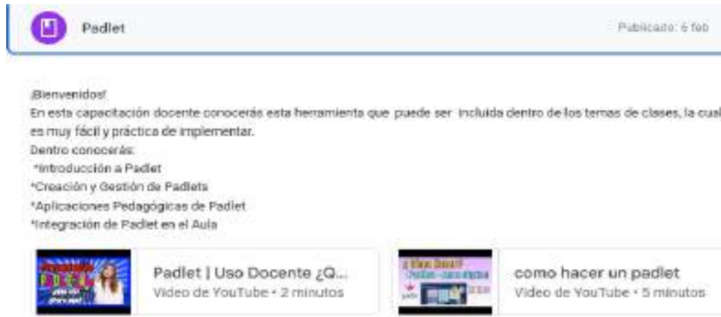
Figura N° 13. Del Módulo 4. Padlet

Nota. La figura muestra la herramienta Padlet que está dentro del capítulo 3, con sus respectivos contenidos y recursos.