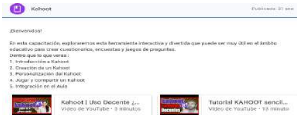
Figura N° 9. Del Módulo 3. Kahoot

Nota. La siguiente figura presenta a la herramienta Kahoot que es parte del módulo 3 y sus recursos compartidos.