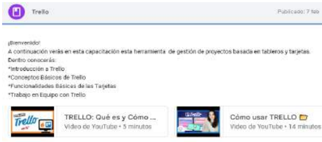
Figura N° 14. Del Módulo 4. Trello

Nota. La siguiente figura presenta la herramienta Trello que está dentro del capítulo 3, con sus respectivos contenidos y recursos.