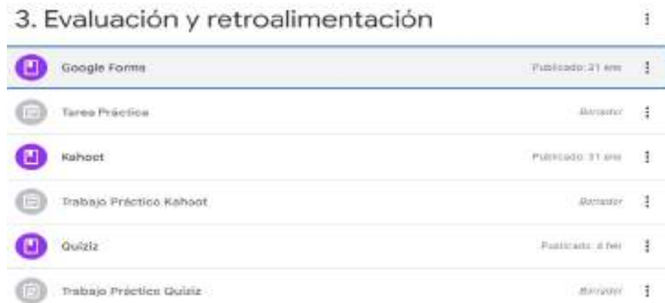
Figura N° 7. Del Módulo 3. Evaluación y retroalimentación

Nota. En esta figura se observa el apartado del módulo 3 de la capacitación.