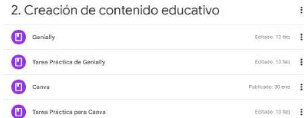
Figura N° 4. Del Módulo 2. Creación de contenido educativo

Nota. En esta figura se muestra el módulo 2 y los contenidos que se tratarán en la capacitación.