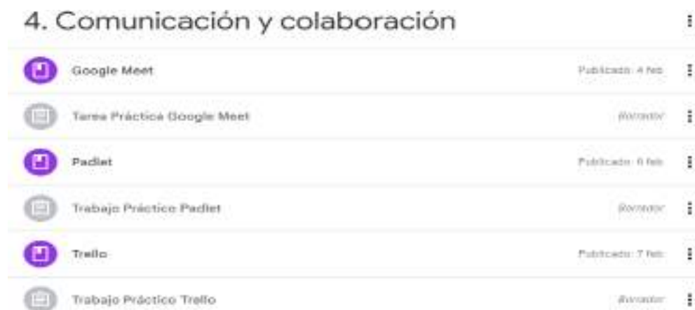
Figura N° 11. Del Módulo 4. Comunicación y colaboración

Nota. La siguiente figura muestra al módulo 4 de la capacitación con sus respectivas herramientas que incluye.