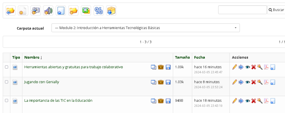
Ilustración 4 - Introducción a Herramientas Tecnológicas Básicas