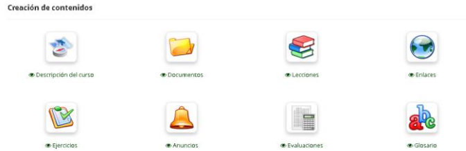
Ilustración 2 - Menú de contenido

El menú de contenido se presenta de manera accesible y se ajusta a los módulos impartidos durante cada semana de clases en el entorno virtual CHAMILO ASSOCIATION. Se encuentra disponible de manera congruente con las temáticas abordadas, facilitando la navegación y el acceso a los materiales correspondientes. Esta estructura organizativa contribuye a una experiencia de aprendizaje clara y ordenada para los participantes, asegurando la coherencia entre el diseño pedagógico propuesto y su implementación práctica en el ámbito virtual.