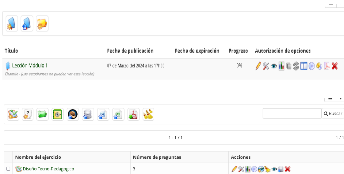
Ilustración 5 - Actividades prácticas de retroalimentación