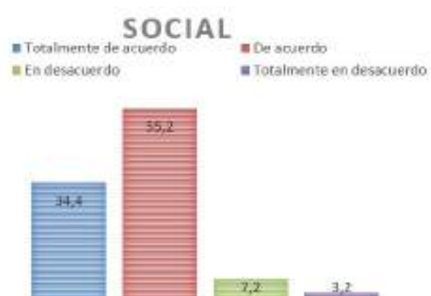
Figura 4 Dimensión 3 “Social”

Sobre la dimensión “Ética”, los datos revelan: Un 37,6% está totalmente de acuerdo en que se deben considerar aspectos éticos al usar TRIC. Un 55,2% está de acuerdo, por lo que el total de docentes a favor asciende a 92,8%. Solo un bajo 5,6% está en desacuerdo y 1,6% totalmente en desacuerdo.