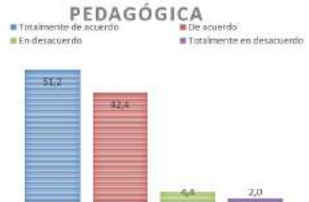
Figura 2 Dimensión 1 “Pedagógica”

En la dimensión “Tecnológica”, los datos revelan que: Un 39,6% está “Totalmente de acuerdo” con que los docentes deben emplear herramientas tecnológicas para mejorar los procesos de enseñanza-aprendizaje. Un 54,8% se mostró “De acuerdo” con la afirmación. Por tanto, el porcentaje total a favor (estando de acuerdo o totalmente de acuerdo) asciende a 94,4%. Solo un bajo 3,6% está “En desacuerdo” y otro 2% “Totalmente en desacuerdo”. Estos resultados evidencian un fuerte consenso positivo (94,4%) en cuanto a la importancia del uso pedagógico de las TIC por parte de los docentes. El porcentaje de quienes no están de acuerdo (5,6% en total) es claramente minoritario.