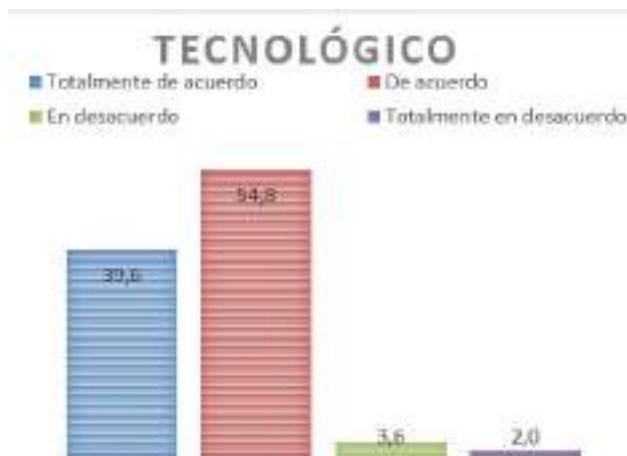
Figura 3 Dimensión 2 Tecnológico

En la dimensión “Social”: Un 34,4% está totalmente de acuerdo en que las instituciones deben promover las TRIC para mejorar la interacción. Un 55,2% está de acuerdo. En total, el 89,6% está a favor, lo que denota un fuerte consenso. Solo un 7,2% está en desacuerdo y un bajo 3,2% totalmente en desacuerdo. Estos datos demuestran que la vasta mayoría de docentes (89,6%) valida el potencial de las TRIC para optimizar la vinculación entre los actores educativos. Este hallazgo respalda los marcos teóricos que sostienen que las tecnologías desempeñan un papel fundamental en la dinamización de los procesos colaborativos.