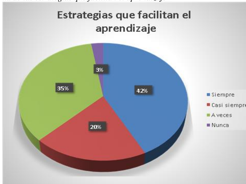
Figura 4 Pregunta de las estrategias que facilitan el aprendizaje