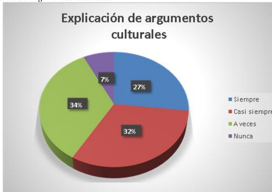
Figura 10 Pregunta de Argumentos culturales