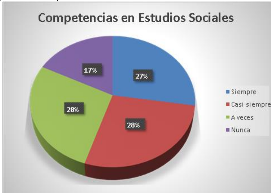
Figura 8 Pregunta de las competencias desarrolladas en Estudios Sociales