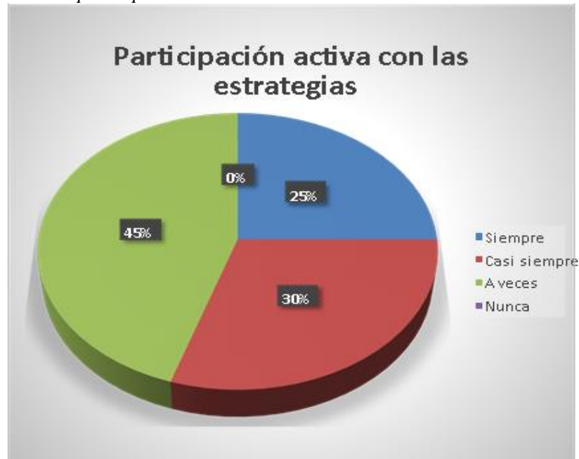
Figura 6 Pregunta de la participación estudiantil