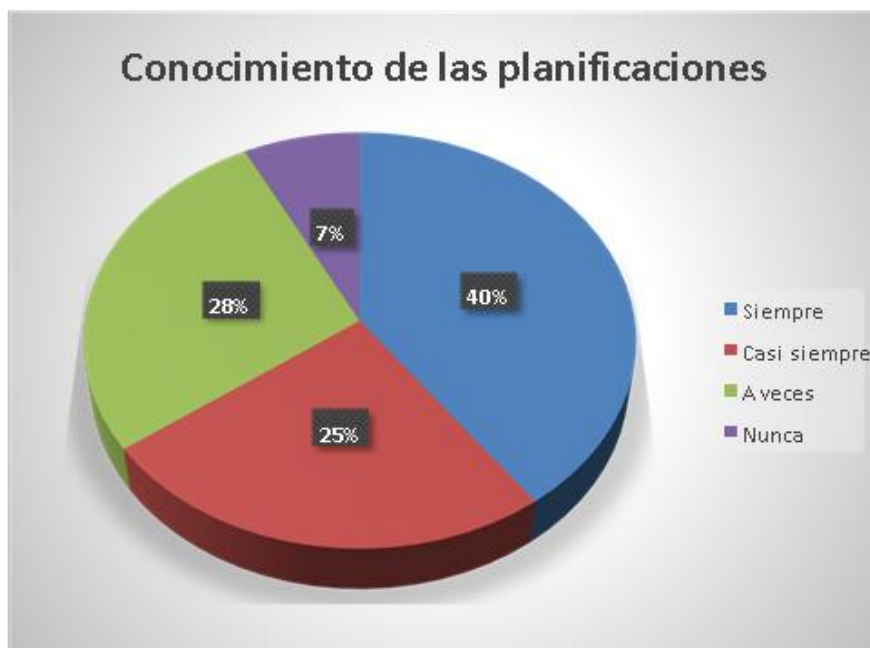
Figura 2 Pregunta de conocimiento de planificaciones