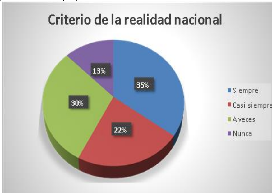
Figura 11 Pregunta del criterio propio de la realidad nacional