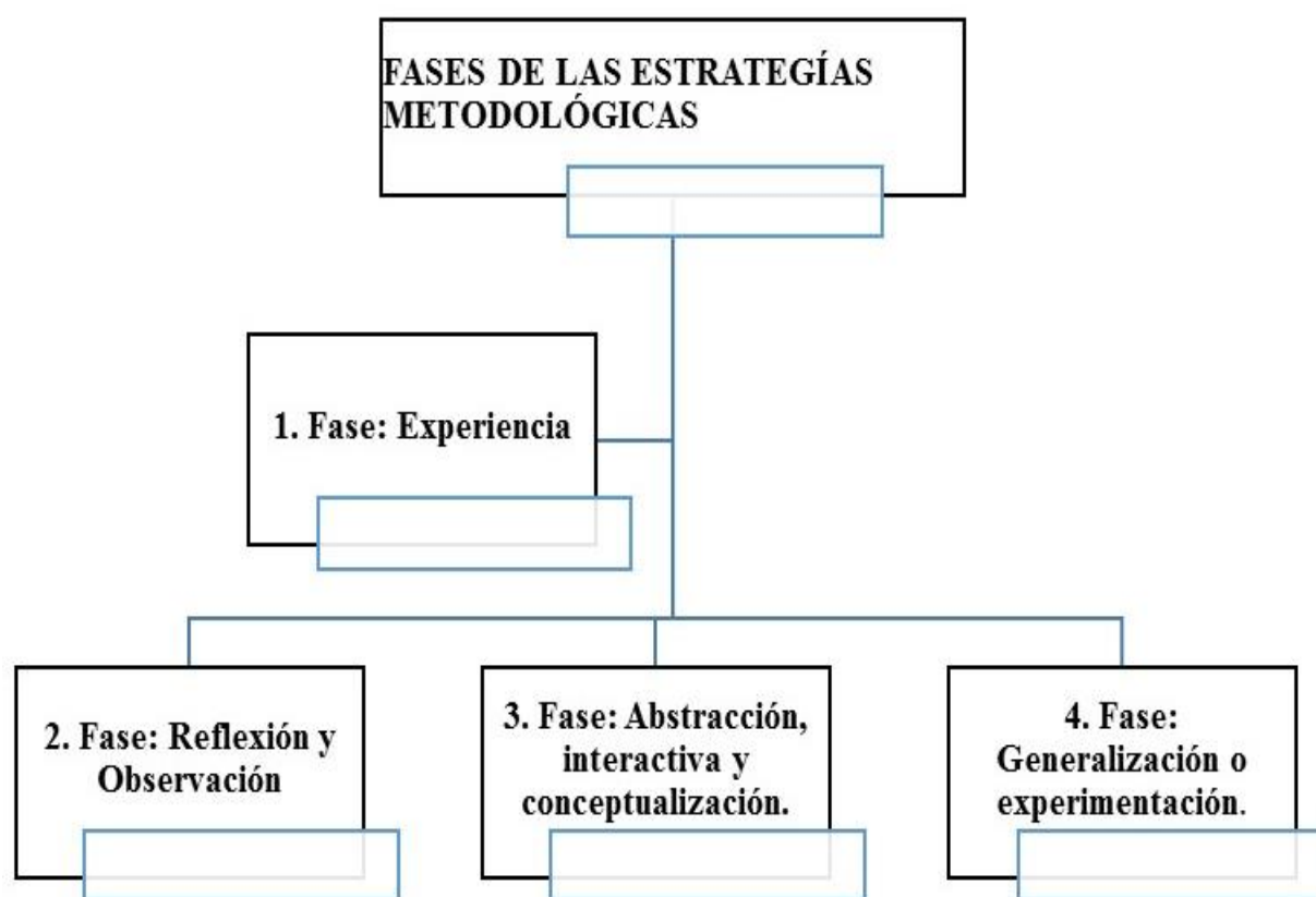
Figura 12 Fases del proceso didáctico de las estrategias metodológicas para el aprendizaje significativo en la asignatura de Estudios Sociales