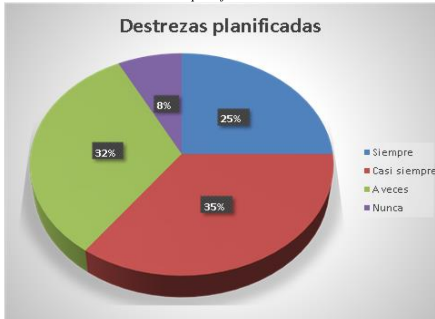
Figura 9 Pregunta del alcance de las destrezas planificadas