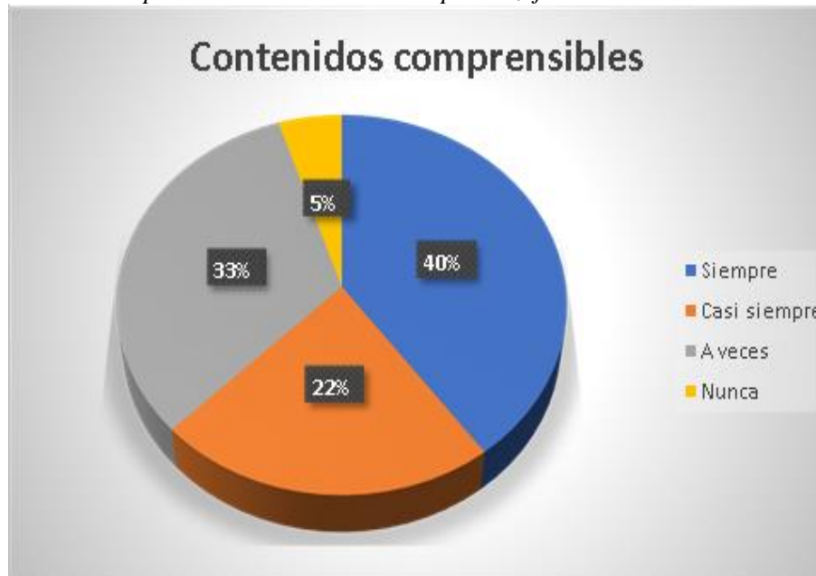
Figura 7 Pregunta de la comprensión de contenidos de aprendizaje