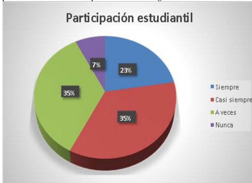
Figura 5 Participación de estudiantes en aplicación de estrategias