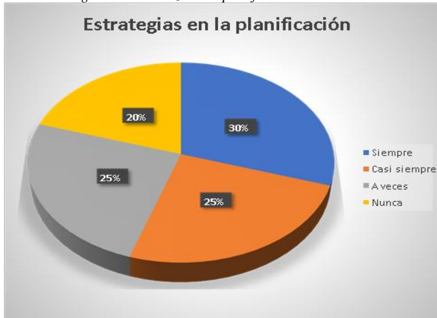
Figura 3 Pregunta de estrategias de enseñanza en la planificación curricular