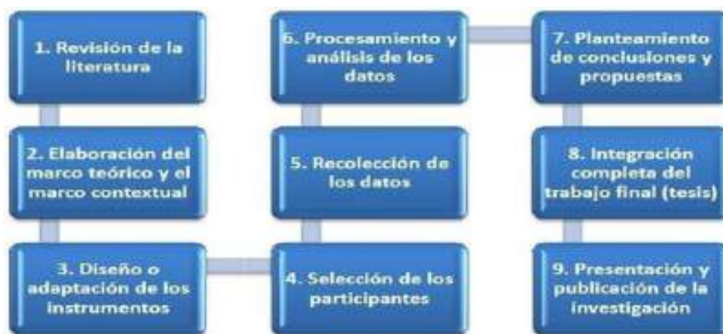
Figura 1 Etapas de Proyecto en Investigación

Nota: Etapas del proyecto de investigación