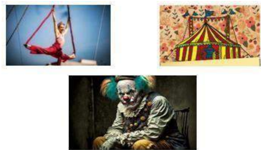
Figura 2 Cuento "El Triple Salto"

Nota: Elaboración propia con base en el recurso "Texto de Lengua y Literatura", Ministerio de Educación, https://educacion.gob.ec/wp-content/uploads/downloads/2016/12/Texto-de-Lengua-y-Literatura-10mo.pdf