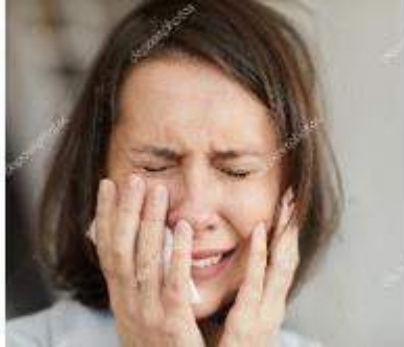
Figura 6 Cuento "La gata"