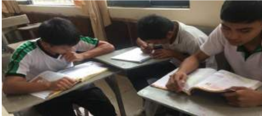
Figura 4 Trabajo Colaborativo

Nota: Elaboración propia con base en el recurso en la Unidad Educativa "Mons. Alberto Zambrano Palacios"