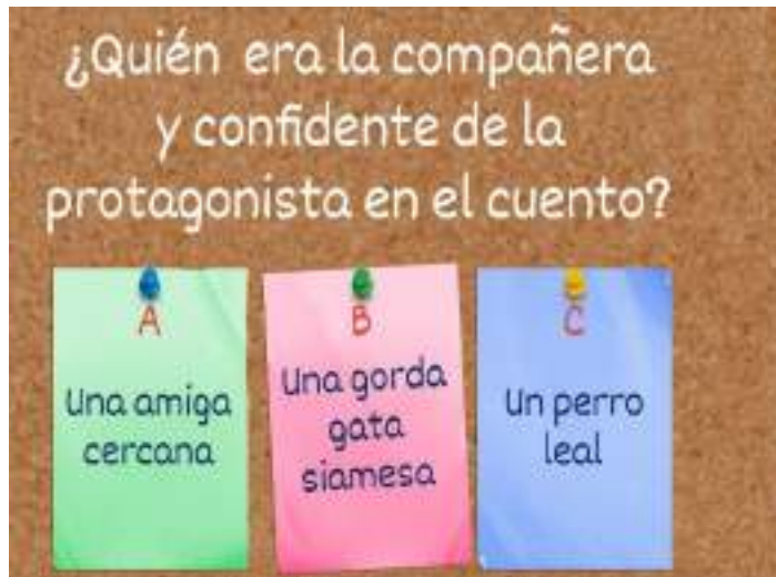
Figura 7 Wordwall, Práctica en Comprensión Lectora "La Gata"

Nota: Elaboración propia con base en el recurso "Cuento La Gata, Autora Aminta Buenaño", WordWall, https://wordwall.net/es/resource/67603180/cuento-la-gata-autora-aminta-buena%C3%B1o