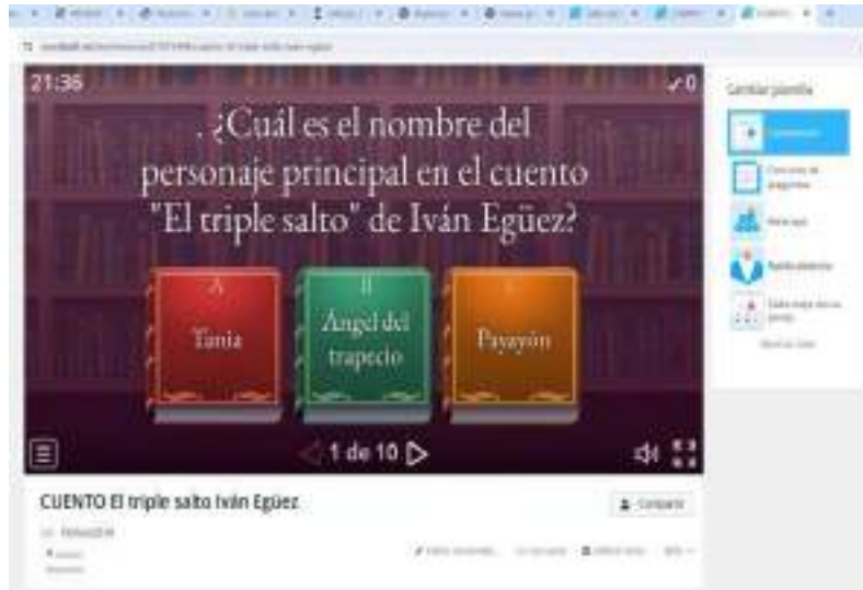
Figura 5 Wordwall, Práctica en Comprensión Lectora “El Triple Salto”

Nota: Elaboración propia con base en el recurso "Cuento Triple Salto, Autora Iván Eguez", WordWall, https://wordwall.net/es/resource/67673444/cuento-el-triple-salto-iv%c3%a1n-eg%c3%bcez