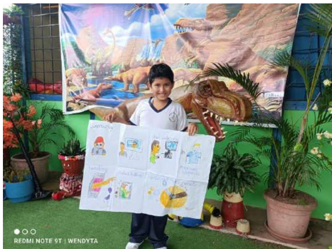
Figura 5 Demostración y celebración de aprendizaje

Nota: El niño exhibe su trabajo, reflejando el conocimiento adquirido y habilidades de presentación, lo que contribuye a un aprendizaje significativo y al fortalecimiento de la confianza en sí mismo.