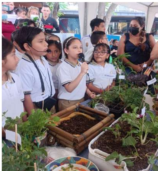
Figura 3 Interacción Social y Presentación de Aprendizaje

Nota: Estudiantes presentando proyectos de jardinería. Los niños muestran su participación activa en la presentación de aprendizajes sobre jardinería, compartiendo conocimientos con la comunidad educativa.