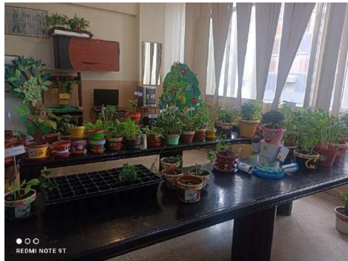
Figura 2 Preparación del Aula

Nota: El aula se convierte en un huerto dinámico, reflejando la fascinación por los dinosaurios.