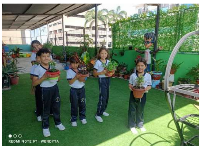
Figura 4 Participación Activa de los estudiantes

Nota: Se observa a los niños desarrollando habilidades motoras y cognitivas a través del manejo de plantas y herramientas de jardinería, fomentando responsabilidad y autoeficacia.