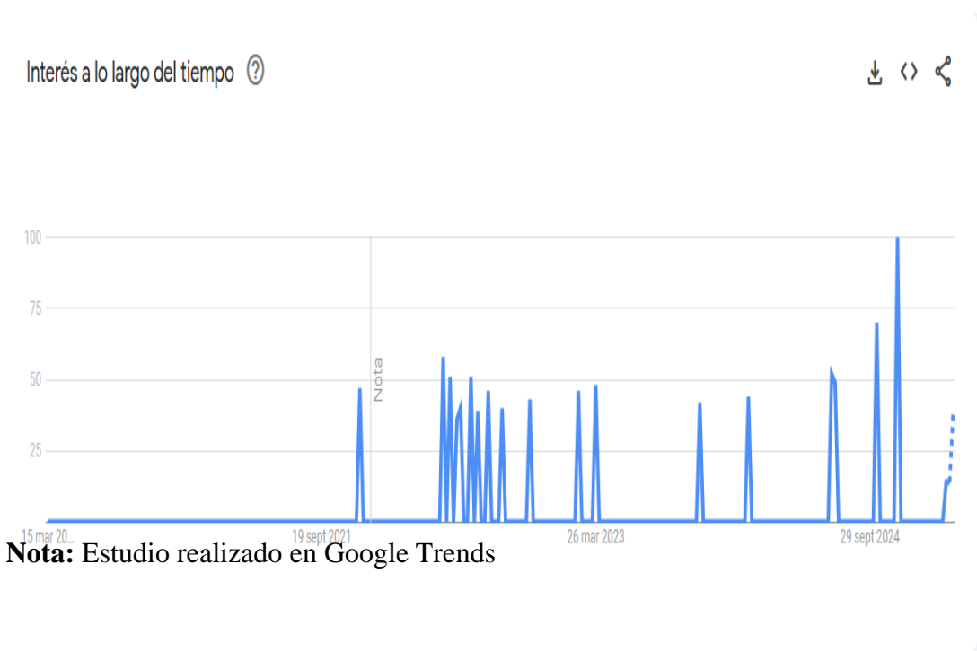
Figura 2 Publicaciones por semana para el término enseñanza de la historia en idioma español en Ecuador y los últimos 5 años.

Nota: Estudio realizado en Google Trends