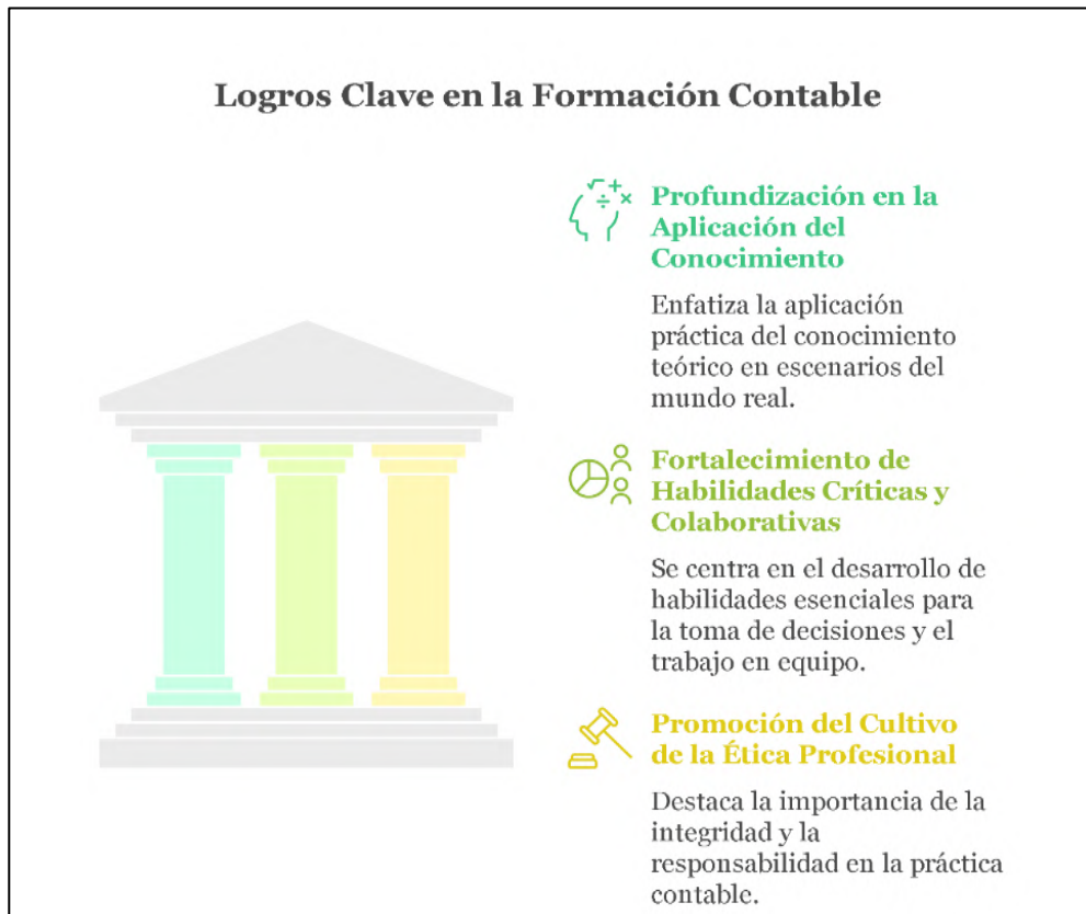
Figura 4. Principales logros

Nota: Logros claves en la formación contable