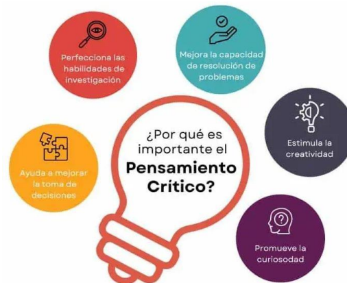
Beneficios del pensamiento crítico

Nota: Este gráfico proyecta elementos y beneficios del pensamiento crítico. Tomado de Díaz (2021).