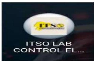
Figura 1. Archivo APK

En la figura 1 se procede a ingresar al aplicativo ITSO LAB a través de un código Qr; mientras que en la figura 2 se muestra la parte inicial de la aplicación donde reconoce cada uno de los dispositivos como, contactores, variadores de frecuencia, temporizadores, guarda motor, entre otros. En la figura 3 propone un menú de cada componente, que tiene video explicativo, funcionamiento, partes constructivas y características: El estudiante interactúa con la aplicación y se despliegan los recursos visuales.