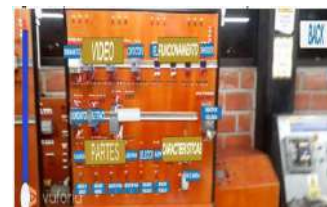
Figura 3: Menú de componente

La figura 4 permite seleccionar el disyuntor termomagnético en funcionamiento y obtener un video que muestra sus características. La posibilidad anterior resulta válida para todos los recursos y elementos del