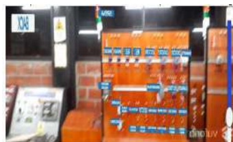
Figura 2: Dispositivos