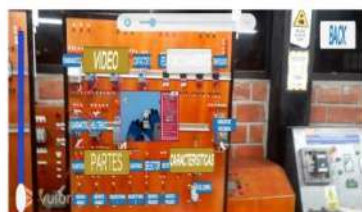
Figura 4: Disyuntor termomagnético operacional