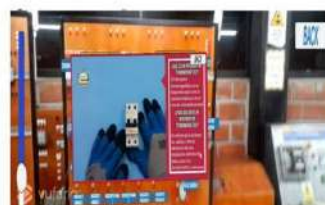
Figura 5: Funcionamiento del interruptor termomagnético