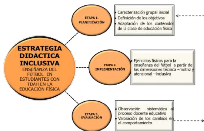
Figura 2. Esquema estructural de aplicación didáctico-metodológica para implementar la estrategia inclusiva en la enseñanza del fútbol a estudiantes con TDAH.