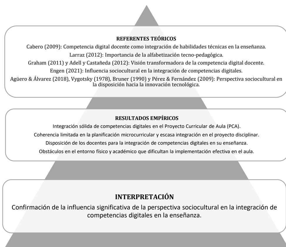
Figura 3. Triángulo de resultados -Referentes teóricos-Resultados empíricos-Interpretación