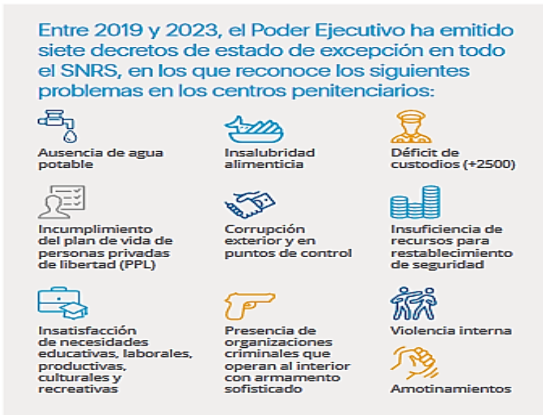
Gráfico 2: Decretos de estados de excepción

Tal y como refiere Espinosa (2023), en el período comprendido entre 2019 y 2023, se ha verificado en los centros penitenciarios la existencia de los siguientes problemas: